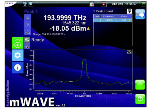
带有绘图功能和分析工具的 HROSA GUI